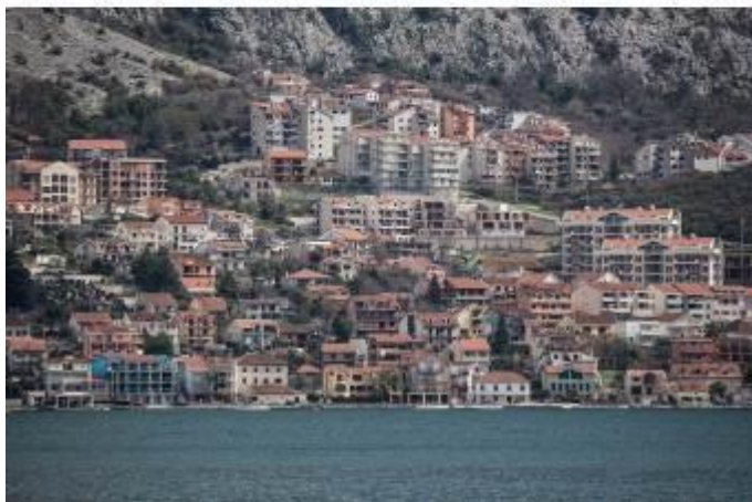
Urbanizacija naselja Dobrota, koja je potpuno pokrila elemente tradicionalnog graditeljstva i transformisala kulturni pejzaž