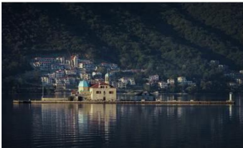
Gospa od Škrpjela sa Kostanjicom u pozadini, prije i nakon igradnje novog apartmanskog naselja u Kostanjici