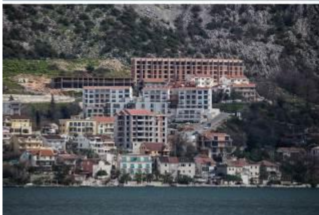
Izgradnja stambenih i turističko-apartmanskog naselja na lokalitetu Kamp, Dobrota

Prateći odluke 40 COM 7B.54 za Područje Kotora, Crna Gora je podnijela Izvještaj o stanju očuvanosti Područja Kotora za 2017. godinu, ali su informacije u tom dokumentu date na način koji ne oslikava u potpunosti pravo stanje Područja Kotora.